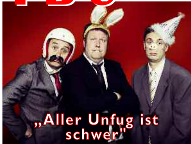
„Aller Unfug ist schwer!“

Guter Unfug hat einen Namen: TBC! Während blutige Amateure wie Markus Söder, Sigmar Gabriel und die AfD billigen Unfug produzieren, kommt beim Totalen Bamberger Cabaret nur geprüfter Qualitätsquatsch auf die Bühne. Mit ihrer einzigartigen Mischung aus fränkischer Coolness und welt offenem Galgenhumor zünden die Zwerchfellschmeichler von TBC ein Feuerwerk des gepflegten Unfugs und helfen ihrem Publikum dabei, über sich selbst und den weltweiten Wahnsinn zu lachen. Als Retter des Abend-, Morgen- und