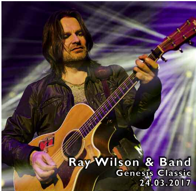
Ray Wilson & Band Genesis Classic 24.03.2017

www.lindenkiller-live.de www.facebook.com/lindenkiller.live