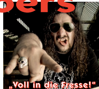
„Voll in die Fresse!“

Lernen durch Schmerz und es gibt nichts, was es nicht gibt, sind seine Devise. Warmduscher, Sockenbügler und andere Weicheier haben Sendepause. Ende Gelände! Schluss mit Perwoll gespültem Trallala – jetzt gibt's voll auf die Fresse! Fränkisch derb – in der Sprache der Straße – schnell, hart, dreckig und laut. Der Rock'n'Rollist sein Motor und der stampft mit Vollgas in die unbenutzten Gehirnwindungen. Synapsen platzen und der ganze alte, verkochte Denkeintopf wird in den Heavy-Metal Mixer geworfen und als hochprozentiger, eisgekühlter Turbo-Brain-Zombie bretterhart neu serviert. Also! Ex oder Arschloch! Zum Wohl!