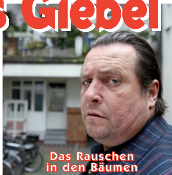
Das Rauschen in den Bäumen

Donnerstag 16.02.12 20.00 Uhr VVK: € 17,- (13,-) • AK: € 19,- (15,-)