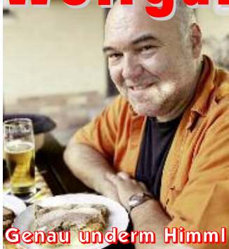
Genau u. d. r. Himm!

Was hat ein Schweinebraten mit dem Yin und Yang zu tun? Warum hat Hänsel gegen das Mastprogramm der fränkischen Hexe keine Chance? War Dürer schwul? Wofür soll Multi-Tasking gut sein und warum besteht Musik nicht nur aus Noten, sondern auch aus Pausen? Fragen über Fragen. Sie werden auch im neuen Soloprogramm „Genau u. d. r. Himm!“ des Bamberger