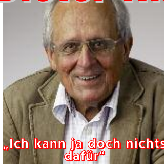
„Ich kann ja doch nichts dafür“