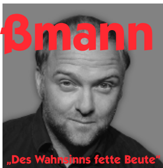
„Des Wahnsinns fette Beute“

Freitag 14.01.11 20.00 Uhr WK: € 11,- (9,-) • AK.: € 12,- (10,-)