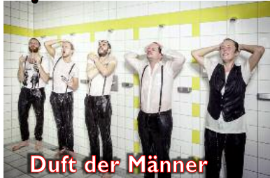
Duft der Männer

Die Welt riecht schon immer nach Männern. Sie verbreiten ihren Duft, markieren ihr Revier, müssen ihre Stärke zeigen. Männer übertreiben es aber auch gerne mal. Sie überdehnen ihr Reich, wollen nicht sehen, wenn ihre Zeit zu Ende geht. Ihr Duft kann genauso animalische Verheißung wie drückender Gestank sein. Und manchmal ist es sogar irgendwas dazwischen. Auch im elften Jahr ihres Bestehens sind 5/8erl in Ehr'n kaum festzumachen, verweben verschiedene Interpretationsebenen,