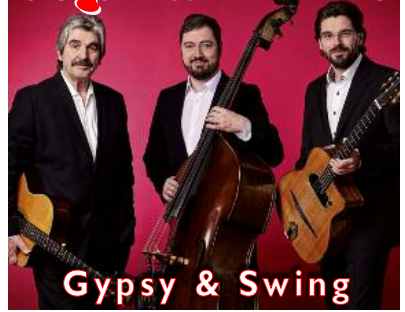
Gypsy & Swing